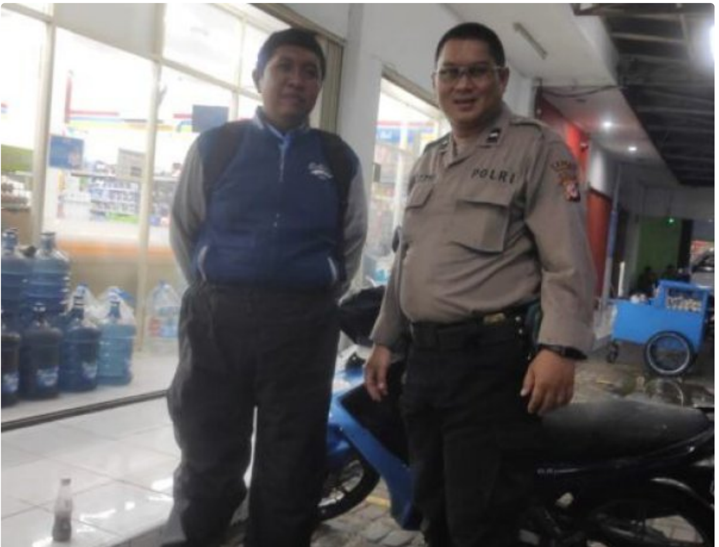
Polsek Kebon Pedes Polres Sukabumi Kota

Kota Sukabumi – Polres Sukabumi Kota Polda Jawa Barat, Polsek Kebon Pedes kembali melaksanakan patroli malam hari guna mencegah tindak kejahatan pencurian kendaraan bermotor (curanmor) di wilayah kecamatan Kebon Pedes. Patroli ini merupakan upaya Polsek Kebon Pedes dalam menjaga keamanan dan