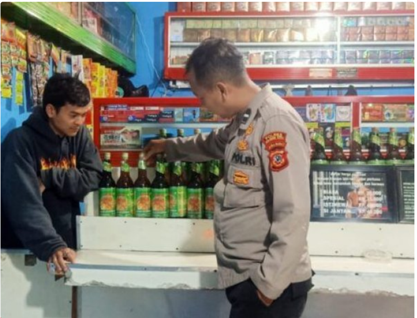
Polsek Sukalarang Polres Sukabumi Kota

Kota Sukabumi – Polsek Sukalarang Polres Sukabumi Kota Polda Jawa Barat, Laksanakan Patroli KRYD (Kegiatan Rutin Yang Ditingkatkan), untuk mencegah