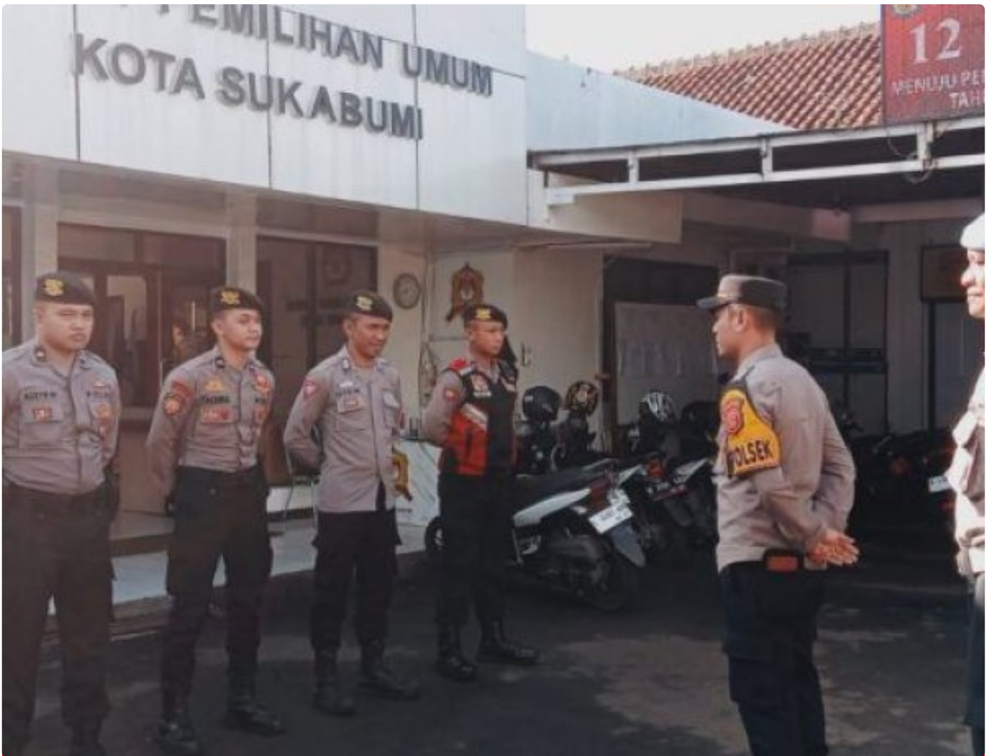
Polsek Citamiang Polres Sukabumi Kota

Kota Sukabumi – Polres Sukabumi Kota Polda Jawa Barat – Guna pastikan aman, Polsek Citamiang Polres Sukabumi Kota menempatkan personilnya untuk